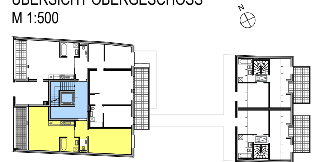
ÜBERSICHT OBERGESCHOSS M 1:500

TERRASSE/BALKON ■■■■ GARTEN ■■■■ ALLG. FLÄCHEN / GANG ■■■■ WOHNUNG ■■■■